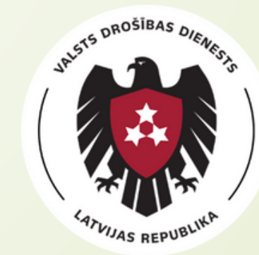
Valsts drošības dienests