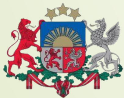
Ministru prezidenta birojs

Apziņojamo amatpersonu sarakstu sagatavo Krīzes vadības padomes sekretariāts un izmanto vienīgi amatpersonu apziņošanai un to glabā: