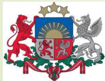
Ministru prezidenta birojs

Apziņojamo amatpersonu sarakstu sagatavo Krīzes vadības padomes sekretariāts un izmanto vienīgi amatpersonu apziņošanai un to glabā :