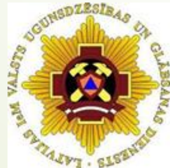
Valsts ugunsdzēsības un glābšanas dienests