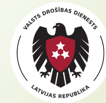
Valsts drošības dienests